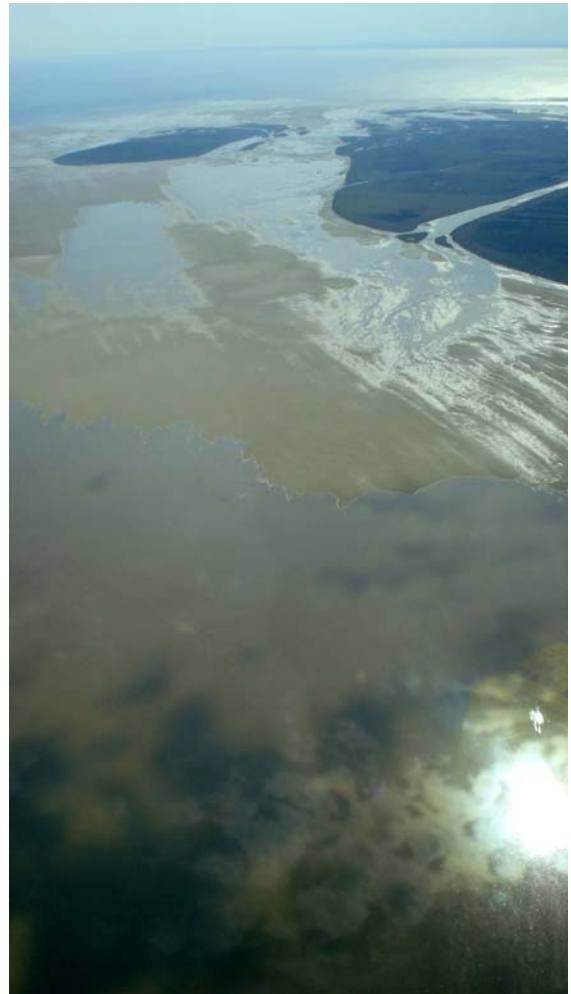
Stora långgrunda områden söder om Läsö.

Vi hann uppleva mycket på en eftermiddag och var ändå hemma till middag. Läsö ligger där för nästa som vill försöka!!