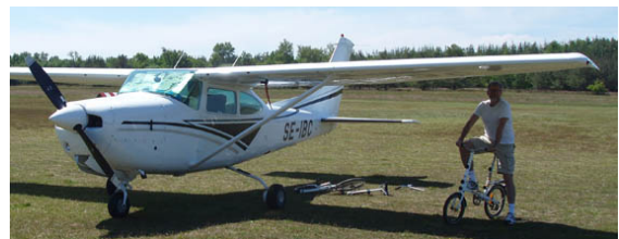
Minicykeln tillåter vingskugga!

Inga aktiviteter på fältet, så vi embarkerade och skruvade ihop Kalles minicyklar för vidare färd till civilisationen: Västerö By.