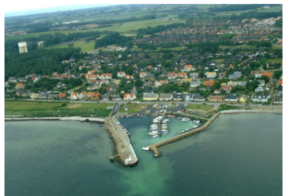
Lång final 06 över Lerbergets hamn